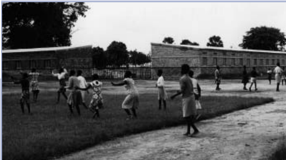
Kongo – Mokambo – misia sv. Jozefa 1982

Hoci sa úplne venoval svojej škole, nezabudol ani na svojich