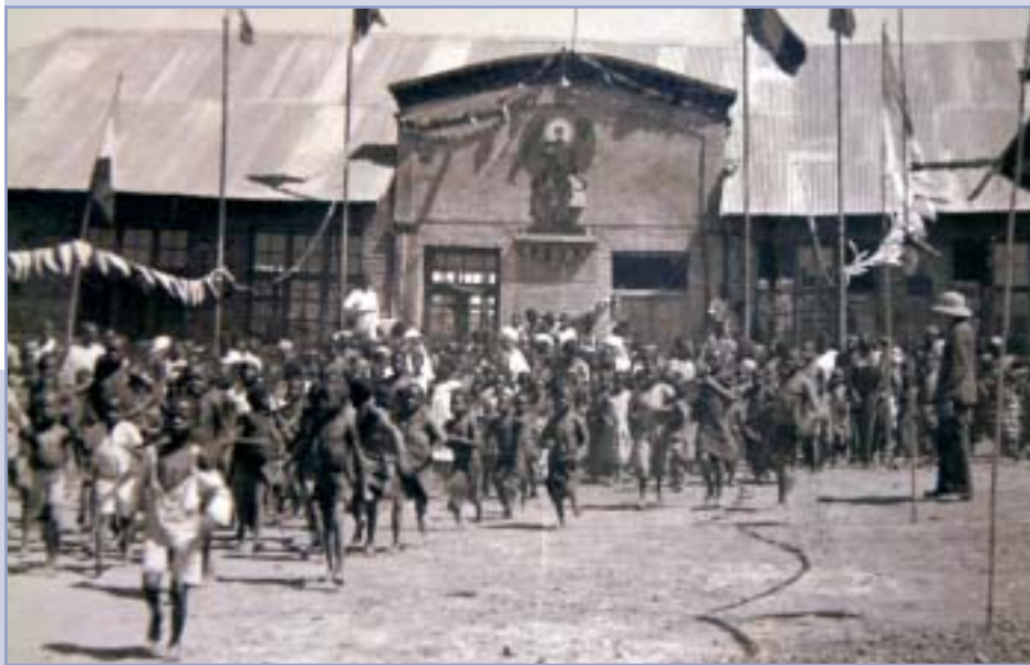
Sakania – 1934 oslavy blahorečenia dona Bosca

V misii mal svojich zákazníkov. Kresťanov z okolitých dedín, žiakov zo školy, chlapcov a dievčatá, sestry a spolubratov, všetci sa radi chodievali k nemu sponedať. Mal svoj turnus nedeľnej kázne, každú