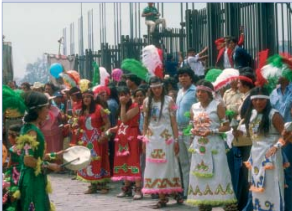
Mexico a jej mnohorasová populácia

Ale žiarivá fakľa jeho života už vysielala posledné, hoci stále jasné záblesky. 24. mája 1956 slávil svätú omšu v našom kolégiu v Huipulcu, po nej šiel na obed do inšpektoriálneho domu svätej Júlie, kde sa ešte poslednýkrát zdržal a vlúdne porozprával s bývalými chovancami, ktorí sa tam zišli, a zaspomínali na krásne spoločne prežité dni. 31. mája mal prísť do nášho kolégia v Mexicaltzingu, aby uzavrel ma-