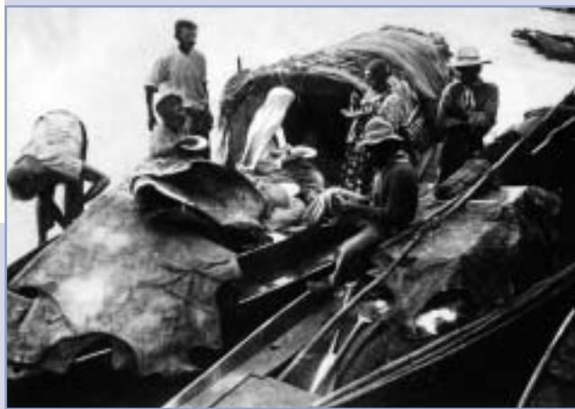
Brazília – Mato Grosso – Carajas