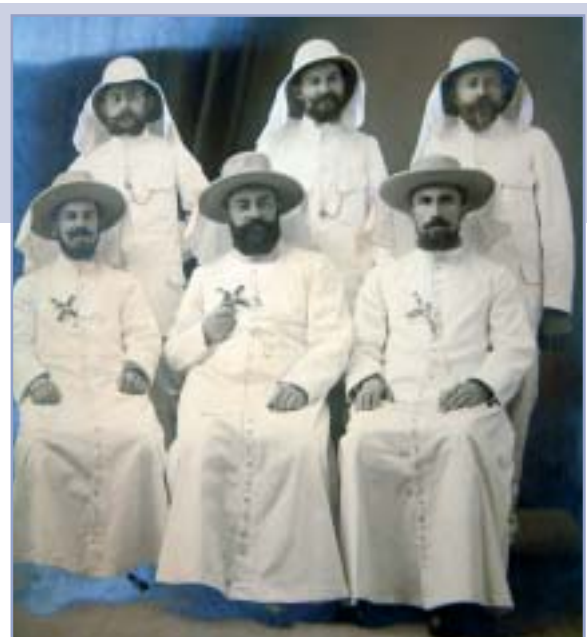
Sakania – prví misionári v Kongu

Potom sa okamžite vrátil do Katangy (Kongo) a pokračoval vo svojom diele v našom ústave v Elisabethville pre európskych žiakov, pričom pomáhal aj v odbornom učilišti