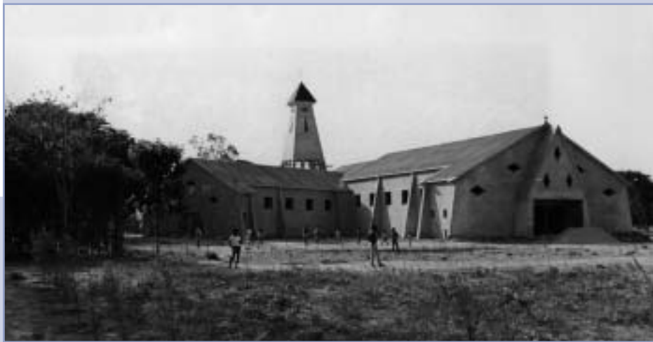
Kongo – Mokambo – misia sv. Jozefa