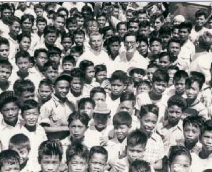
Don Carlo – Filipíny – Bagalao

a prostriedky, s ktorými mohol zabezpečiť nevyhnutnú výchovu mnohým chudobným a opusteným mladým.