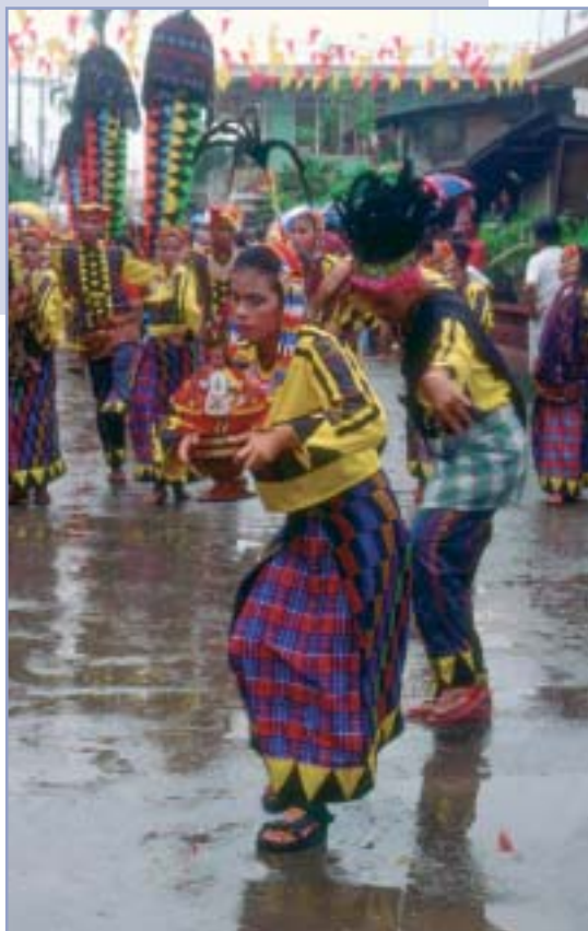
Filipíny – hlboko veriace katolícke obyvateľstvo

Popri svojom dlhom apoštoláte a popri vytváraní mnohých diel