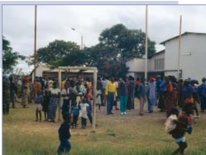
Misia sv. Karola Lwangu v Kipushi, sídlo biskupa zo Sakánie