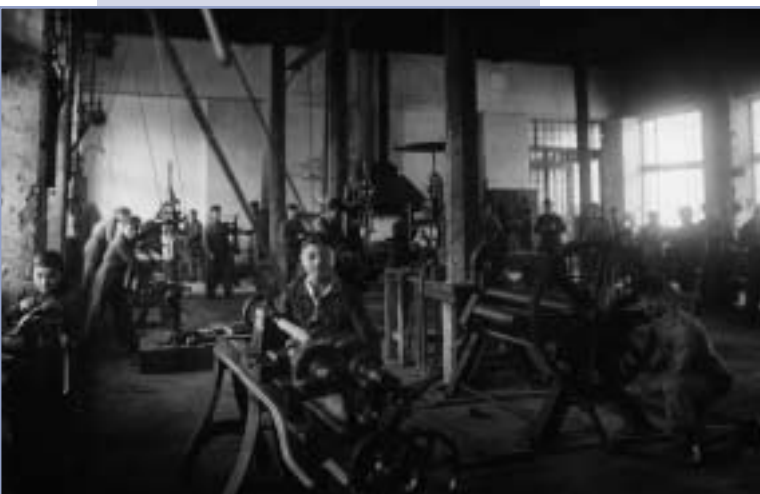
Concepcion – Chile – zámočnícka dielňa

dielo, s veľkým srdcom dona Bosca nábádal, aby sa otvorili všetky brány davom opustených a ohrozených chlapcov, čím si zaslúžil titul Otec detí ulice. A toto nádherné kvitnúce dielo kresťanskej lásky zostane