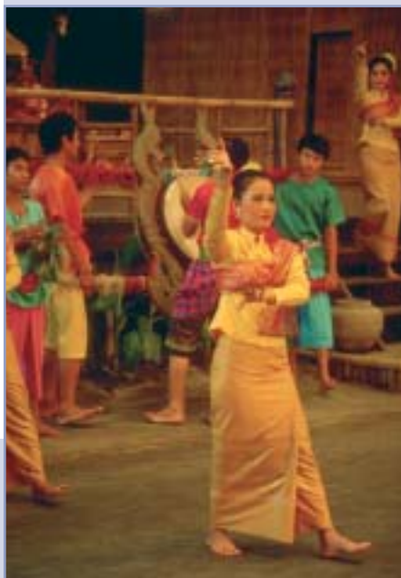
Thajsko so svojimi krásnymi tancami