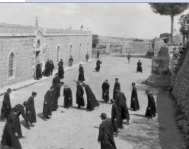
Cremsan. Tu študovali viacerí saleziáni zo Slovenska