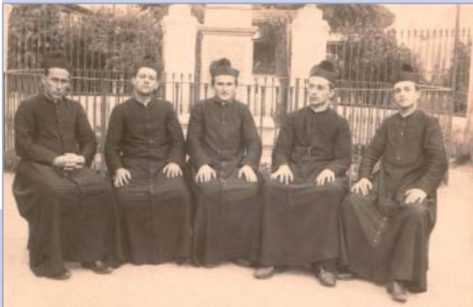
Rok 1902 v Las Piedras, keď bol ešte len donom