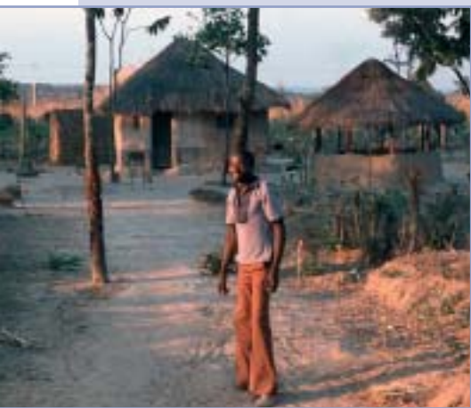
Sakania – typický vidiecky dom

drahých černochoch. Každý týždeň sa v sobotu poobede pobral na bicykli do misie La Kafubu, hlavného strediska vikariátu v Sakanii.