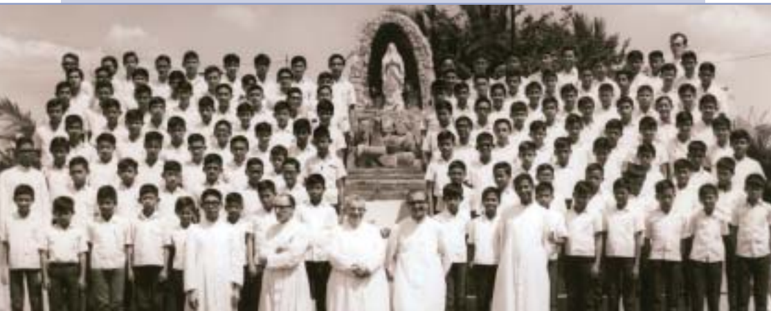
Filipíny – Tondo. Malý seminár v r. 1970

Zblízka sa zaujímal o duchovný život rôznych náboženských komunít, zúčastňoval sa ich osláv a vystúpení. Pre kňazov a misionárov mal otcovské srdce.“