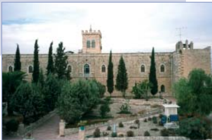
Beitgemal r. 1999