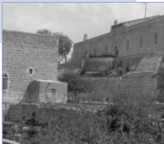
Cremisan v minulosti. Dnes je miestom medzinárodnej teologickej fakulty

V Jeruzaleme sa stále jazdilo na chrbte somára alebo mulice. Ugetti chodieval s ružencom v ruke, modlil sa a spieval, ako hovorieval,