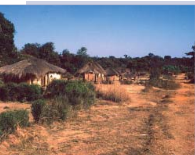
Sakania – vidiek dnes