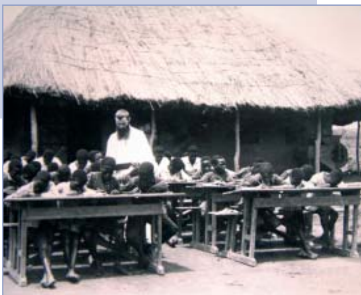
Sakania – škola pod holým nebom

Vždy sa vkladal celý do tohto diela, s veľkou horlivosťou a s duchom obety. Ale keď jeho pomoc už nepotrebovali, s veľkou rados-