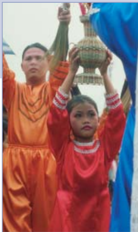
Filipíny – detail zo slúženia sv. omše