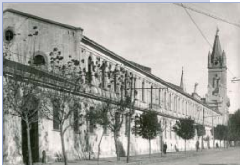
Concepcion – Chile – Kostol P. M. Pomocnice

XIII. generálna kapitula schválila Pravidlá misií „ad experimentum“. V tom istom roku Posvätná kongregácia pre šírenie viery vydala inštrukciu, ktorá upravila vzťahy cir-