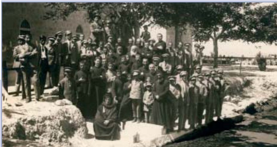
Svätá zem – Beitgemal r. 1923

V jednom svojom liste z roku 1959 mi píše: „Som skutočným Máriiným synom. Do Kongregácie