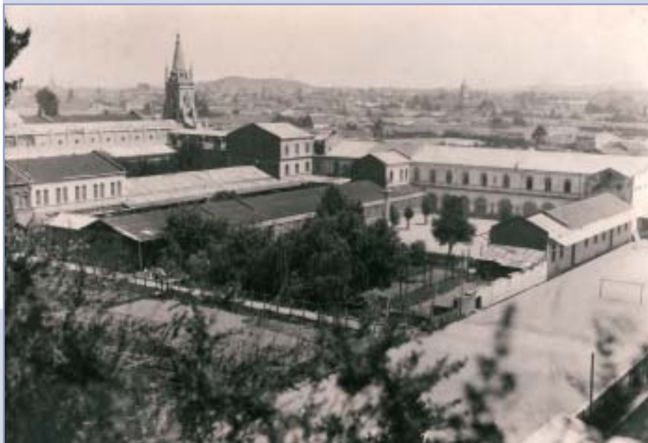
Concepcion Paraguay - Gymnázium P. M. Pomocnice

V roku 1939 sa politický obzor Európy zatemnil, takže misie potrebovali zabezpečiť pomoc z Ameri-