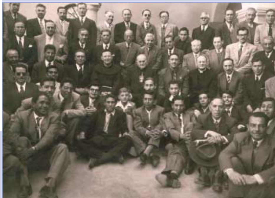
Mexiko – s bývalými saleziánskymi chovancami

Medzi viditeľné ovocie, ktoré zostalo po jeho diplomaticko-náboženskej činnosti, patrí vytvorenie diecézy v Toluca, povýšenie na arcidiecézu diecézu vo Veracruze, založenie misie sui juris v Tarahumare a menovanie mnohých mexických biskupov.